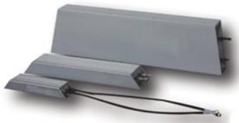
Резисторы ZC-BR-80W ... ZC-BR-1000W в алюминиевом корпусе

пар – параллельная схема, пос – последовательная схема, (пос)пар – комбинированная схема